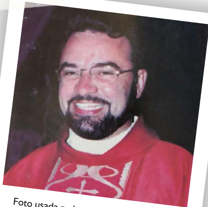
Foto usada na lembrança dos 15 anos de ordenação sacerdotal, em 2003

Nosso pároco e pastor também tem um dom de conduzir o povo à palavra de Deus. Com uma oratória influente, fala das coisas do Pai com