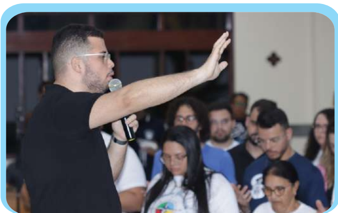
Com o tema "Vocacionados ao Amor além de muita espiritualidade", o evento reuniu famílias da paróquia nos dias 27, 28 e 30 de novembro.