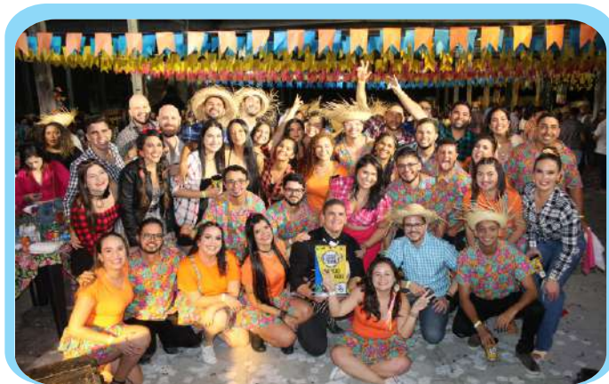
Alegria tomou conta da tradicional festa junina de nossa paróquia que aconteceu no dia 17 de junho de 2023 no Parque Aristófanes Fernandes, em Parnamirim.