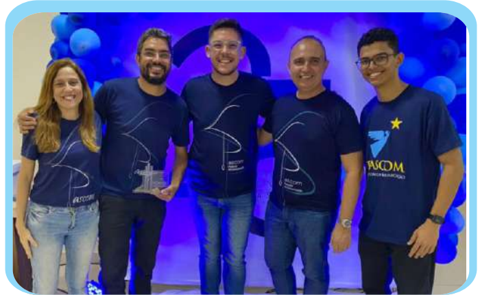
AGOSTO - Pascom recebe prêmio da Arquidiocese por reportagem sobre Pastoral da Juventude Missionária