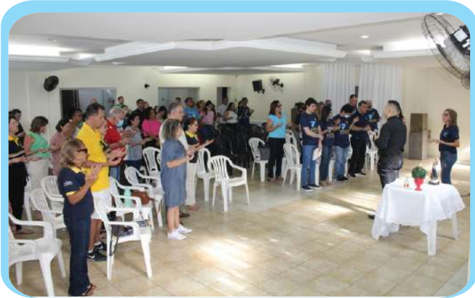
MAIO - I Workshop Comunica, momento de compartilhar formação entre agentes da Pascom e das demais pastorais